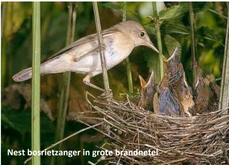
Nest bosrietzanger in grote brandnetel