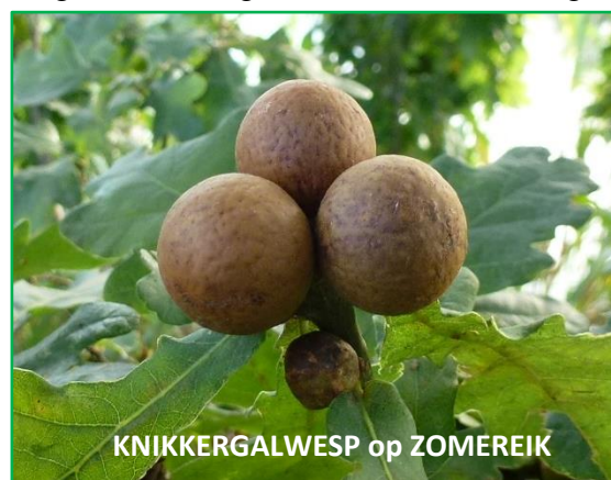
KNIKKERGALWESP op ZOMEREIK

Het min of meer verdoken leven van de gallen is nog niet volledig uit de doeken gedaan en vraagt nog veel studie. Wat gallen ons al wel hebben geleerd is dat ook hier de natuur echt goed in elkaar steekt en er een sterke samenhang is tussen plant en dier. Een sterk staaltje natuurkracht waar je zomaar van kan genieten... ergens langs een wandelweg in onze meersen!