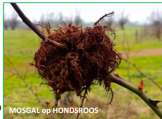
MOSGAL op HONDSROOS