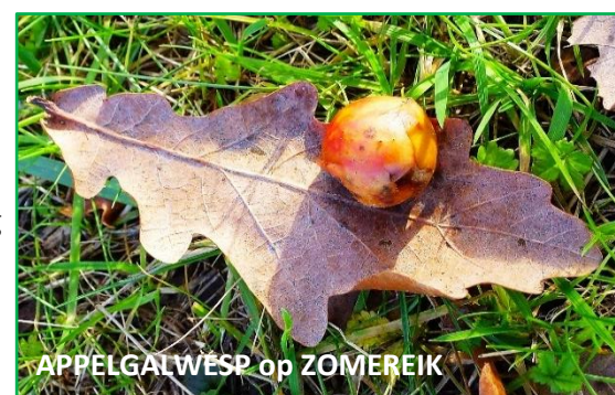
APPELGALWESP op ZOMEREIK

De volgende stappen in de levenscyclus verschillen van soort tot soort. Bij sommige veroorzakers voltrekt de volledige 'groeicyclus' (eitje-larve-verpoping) zich binnen de veilige gal. Na dit stadium zijn er soorten die hetzelfde seizoen de gal verlaten en anderen die liever overwinteren in de gal tot de volgende lente. Dit kan nog hangend aan boom of struik maar