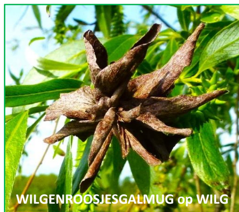
WILGENROOSJESGALMUG op WILG